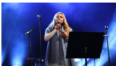
Helene Bøksle sang sørlandsviser for et tettpakket publikum lørdag.

Årets konsertprogram under Tall Ships Races byr på varierte sjangre og en stor variasjon i artistrekken. Men en rød tråd er at artistene har en tilknytning til Sørlandet.